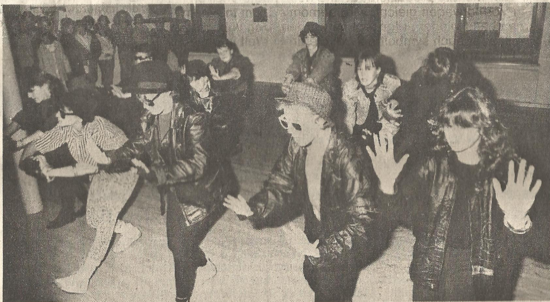
Zu Michael Jacksons „Bad“-Lied tanzten die Jugendlichen in überwiegend schwarzer Kleidung.

Nach dieser Aufführung ist die Tanz-Lust der Jugendlichen längst nicht verschwunden: Sie wollen als Gruppe weitermachen und sich um neue Auftritte bemühen. kor