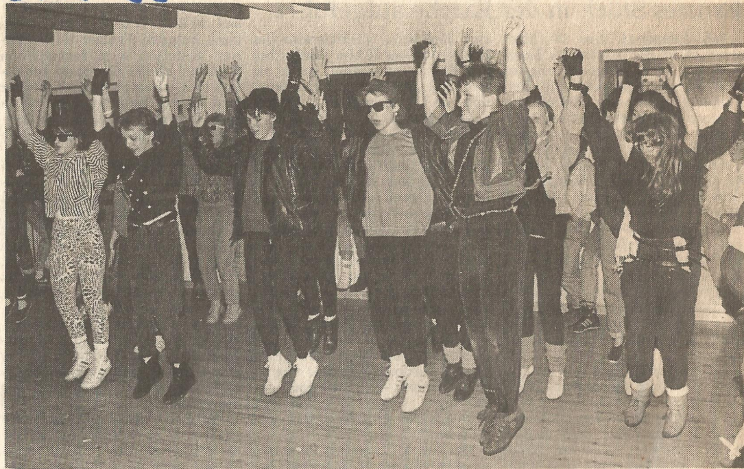
Mit einer Tanzeinlage à la Michael Jackson sorgte die Mädchen-Tanz-AG des Jugendheims Barenburg am ersten Discoabend für Stimmung. Der Treffpunkt ist ab sofort jeden Donnerstag bis 22 Uhr geöffnet.