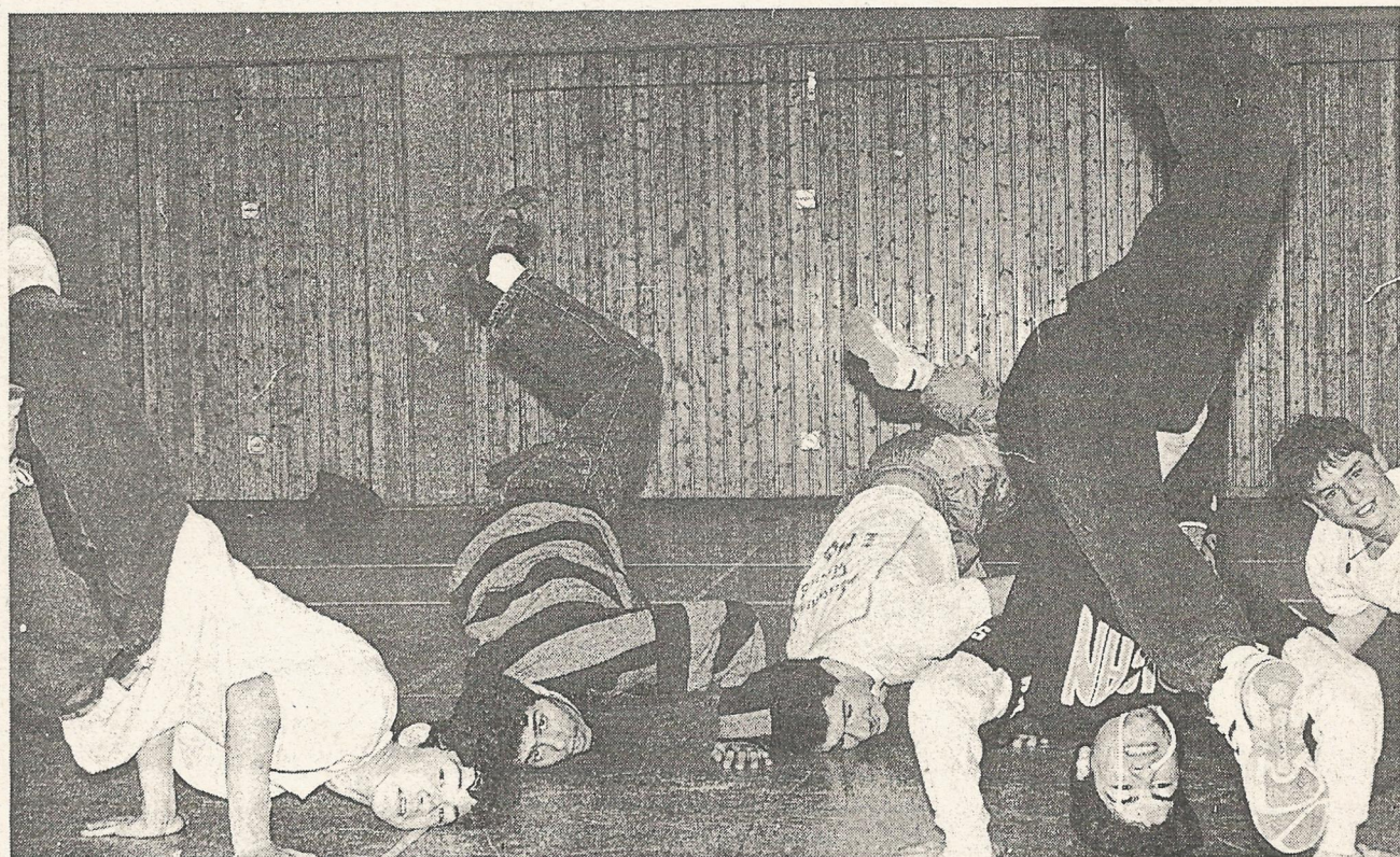
Die Barenburger Jugendgruppe „First Step“ beim Breake-Dance Training.

Nach einigen Hip-Hop-Jam's, die auch zusammen mit jungen Leuten aus einem Groninger Jugendhaus veranstaltet worden sind, konnte eine Emdener Dance-Crew „Face da Funk“ neben anderen öffentlichen Veranstaltungen, in einer Live-Sendung im Fernsehen auftreten.