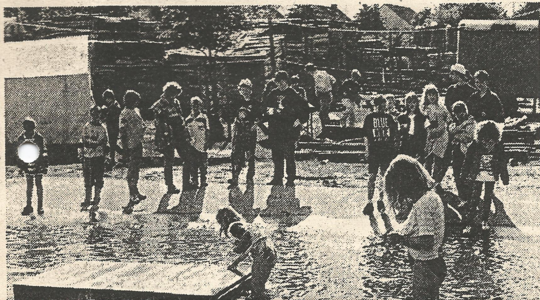
Das Pfingstcamp auf dem Fallersleber Bauspielplatz wurde von 120 Kindern am Wochenende bei Spiel und Spaß gut genutzt.