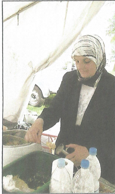
Internationale Speisen wurden laufend frisch zubereitet und fanden entsprechenden Absatz.