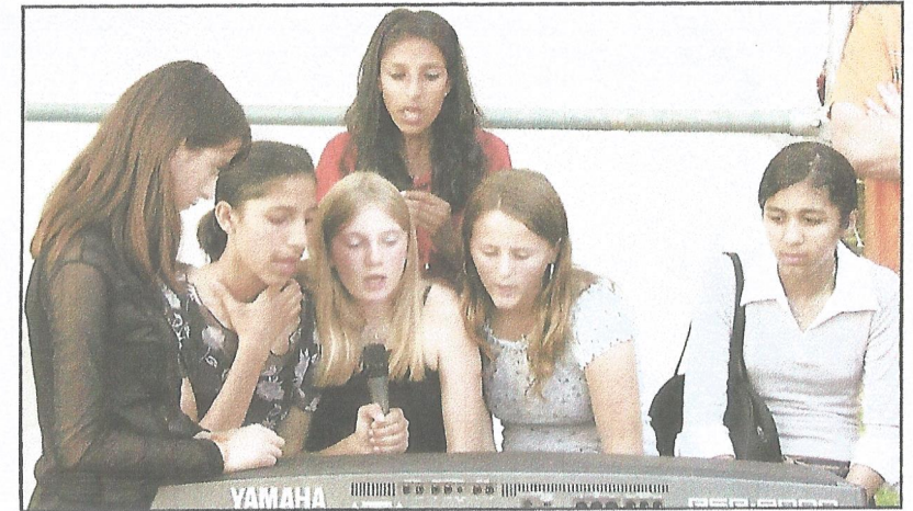
Spontanität: So wie diese Mädchen nutzen viele die Möglichkeiten einmal etwas anderes und neues auszuprobieren.