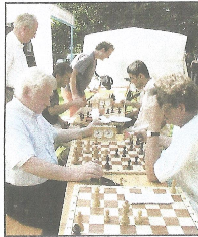
Für eine Partie Schach war auf den Fest auch Zeit.

schlag „Wir in Barenburg“. Das kulturelle Tanz- und Gesangsprogramm war so vielfältig, dass Jung und Alt ihre Freude hatten. Außerdem konnte der kleine und große Hunger national oder international gestillt werden, und vielleicht konnte auf dem Flohmarkt das ein oder andere Schnäppchen ergattert werden. Auch die Kinder und Jugendlichen hatten ihren Spaß an den Spiel-, Bastel- und Sportaktionen.