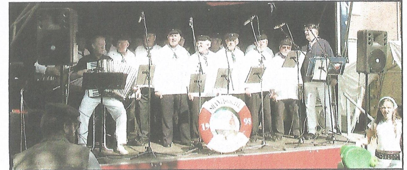
Maritimes: Die Shanty-Gruppe aus Port Arthur/Transvaal