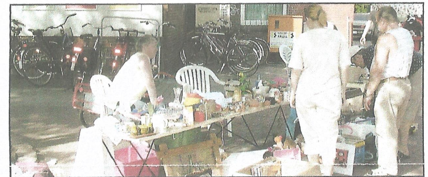
Flohmarkt: So manches Schnäppchen wurde hier gemacht